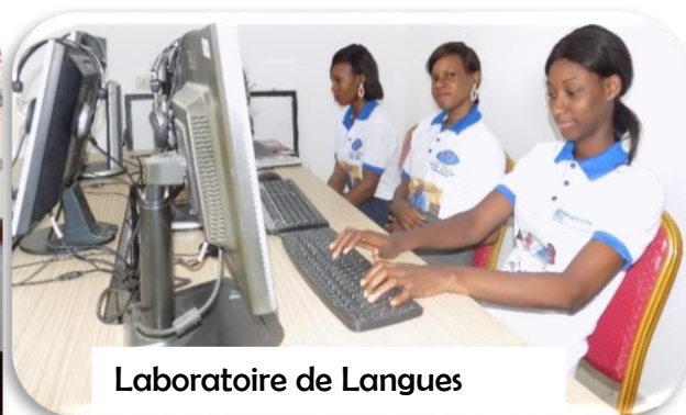
Laboratoire de Langues