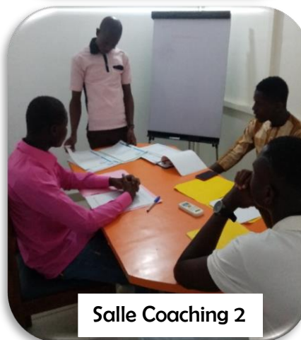
Salle Coaching 2