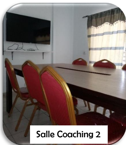
Salle Coaching 2